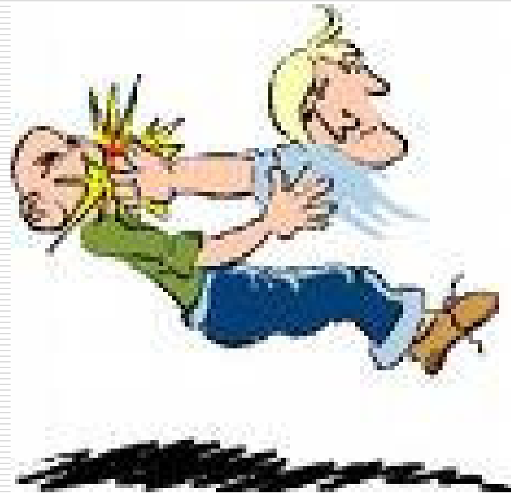
Delito de lesiones